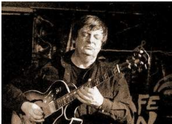
Philip Catherine (* 27. Oktober 1942 in London)

Philip Catherine, Sohn einer Engländerin und eines Belgiers, stammt aus einer musikalischen Familie. Er begann Gitarre zu spielen, nachdem er George Brassens gehört hatte. Früh entdeckte er sein Interesse für den Jazz. Einen großen Einfluss hatte die Musik von Django Reinhardt auf seine Entwicklung als Gitarrist.